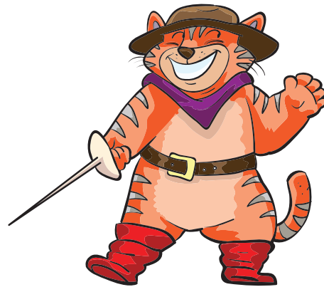
Der gestiefelte Kater