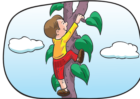
Hans und die Bohnenranke